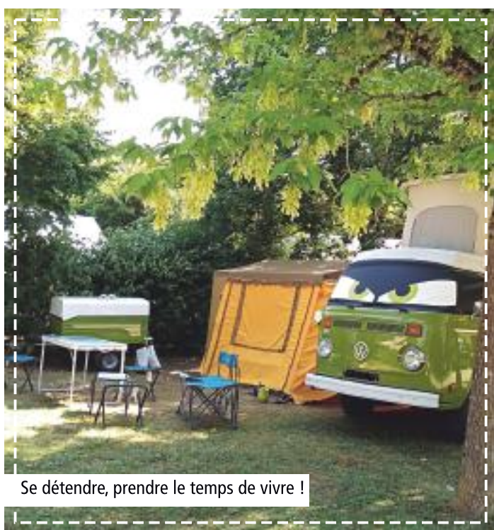
Se détendre, prendre le temps de vivre !