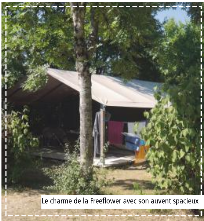
Le charme de la Freeflower avec son auvent spacieux

Profiteer van onze comfortabele stacaravans met 2 of 3 slaapkamers of van onze sfeervolle Freeflower of chalet op palen, tenten zonder badkamer.